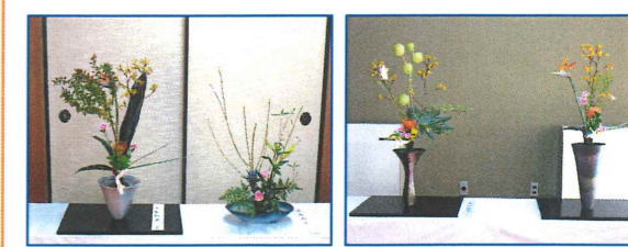
〈昨年の文化の集いでの展示作品です〉