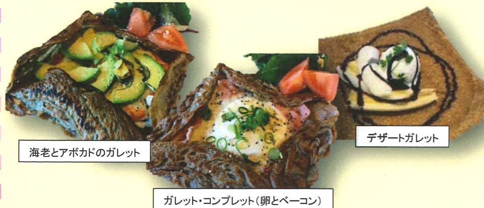
海老とアボカドのガレット

材料の代替対応や器具の使い分けなど、食物アレルギー対策は行っておりません。アレルギーをお持ちの方は、ご自身の責任でご参加ください。なお、使用食材につきましては直接お問い合わせください。特にそば粉は調理後も髪や衣服に付着しますので、ご家族にアレルギーをお持ちの方がおられる場合はご注意ください。