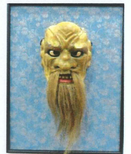
鼻瘤悪尉(はなこぶあくじょう)

能面を作り上げる作業は、一般的には能面材として木曾桧材を使いますが、それを打つとき、ここで、能面の場合は、面を彫るとは言わないで打つと言います。面の姿を木の中から打ち出すという精神的な響きがあり、ただ彫るのとは違います。「打つ」とは、もっと緊張感の漲ることであり、つまりは、心を込めるということになるのかもしれませんが...能面打ちの工程は、木どり、荒打ち、粗打ち、小作り、仕上げ、彩色、下塗り、みがき、上塗り、汚し、古色、彩色、毛描き、などの総仕上げを経て、完成ということになります。まさに、各種の美術工芸技術の結晶化されたものと言えましょう。【作者の説明文より】