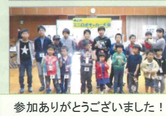
参加ありがとうございました!