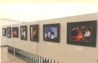
写真愛好家作品展