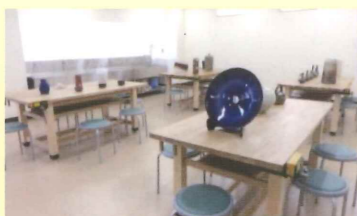
高月まちセンサークル 陶芸クラブ作品展