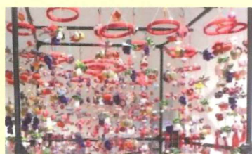
高月まちセンサークル つるしびなの会作品展