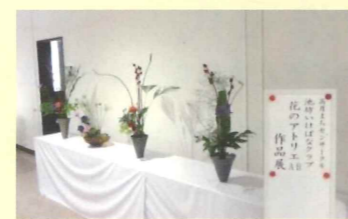
高月まちセンサークル 池坊いけばなクラブ 花のアトリエ A・B 作品展