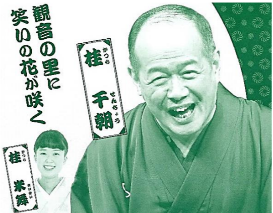
観音の里に 笑いの花が咲く

主催/NPO法人 花と観音の里 共催/高月地域づくり協議会 長浜市老人クラブ連合会高月支部